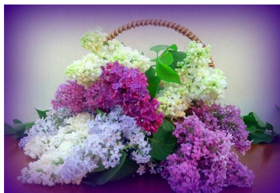
В городе цветут ландыши

Апрель — пора цветения. И потому люди, рождённые в этот период, умеют радовать окружающих. Они — настоящие, верные друзья, ответственные работники, полные креативных и ярких идей. Пусть в вашей жизни всегда будет место настоящему празднику!